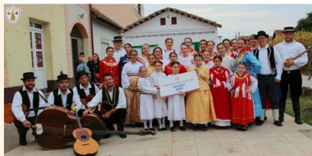
28. MIHOLJSKO KOLO - 75 GODINA KUD-a IVAN GORAN KOVAČIĆ

Miholjsko kolo još je jednom potvrdilo svoju važnu ulogu u očuvanju kulturne baštine i jačanju zajedništva u Lovasu, uz najavu susreta i iduće godine.